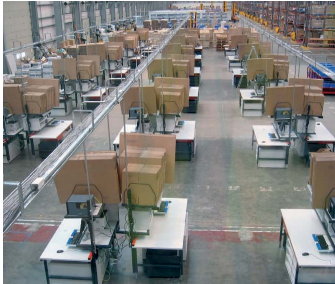
Tesco-Online-Distribution: auf Ansturm vorbereitet

Mit vielen tausend Einzel- und Verbrauchermärkten ist Tesco in Großbritannien der mit Abstand größte Einzelhändler. Jetzt ging als neuer Vertriebsweg tesco.com an den Start: der Internet-Shop des britischen Großfilialisten. Binnen kürzester Zeit musste dafür ein leistungsfähiges Logistikzentrum mit großer Paketpack-Kapazität realisiert werden. Der Welberter Spezialist für Verpackungstechnik und Betriebseinrichtung Hüdig + Rocholz sorgte für den Aufbau einer der größten und leistungsfähigsten „Paket-Fabriken“ im englischen Daventry.