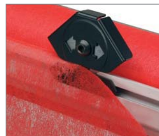
Schneideinheit cutting unit module de coupe

Le module de coupe, y compris le bord d'arrachement, est également disponible comme élément séparé et peut aisément remplacer le dispositif de série sur les dévidoirs VARIO déjà existants en raison de sa similitude de construction. Toutefois, la largeur de coupe est alors réduite d'environ 20 à 25 cm.