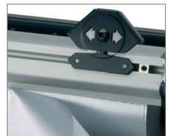
Abreibkante tear-off edge bord d'arrachement